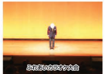
ふれあいカラオケ大会

今年も恒例の福祉まつりが開催されました。当日は天候も良く、多くの参加者が集まり、福祉への関心の高さを感じることができた1日となりました。チャリティバザー収益金は善意銀行を通じて、今後の福祉事業に役立てさせていただきます。