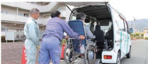
(送迎サービスの様子)

ふれあい蒲郡は在宅介護等でお困りの方や日常生活に支障がある方が「利用会員」になり、地域のなかから参加した「協力会員」が、介護や家事援助サービスを有料で提供する会員制の相互扶助の制度です。