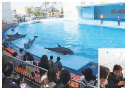
▲イルカショーを見てきました (南知多ビーチランドにて)