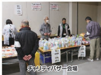
チャリティバザー会場