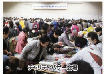
チャリティバザー会場