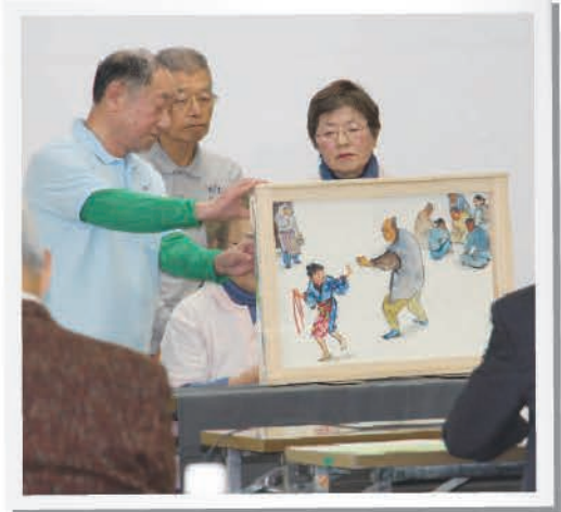
昨年度の公募事業の様子

蒲郡市内のボランティアグループ、市民活動団体及び福祉的な課題に取り組んでいる団体・グループ等の活動の促進と共同募金への理解の拡大を目的に、共同募金の配分金の一部を財源として公募を行い、公開プレゼンテーションによる審査会を経て助成する事業です。