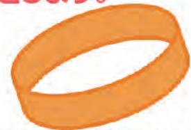
▲認知症サポーターの証「オレンジリング」