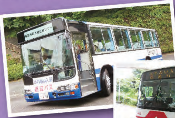
ふれあい入浴は2台のバスで お迎えに参ります。

寿楽荘では水曜日の【ふれあい入浴の日】に大広間の舞台上、歌や踊り、楽器演奏などを開催しています。