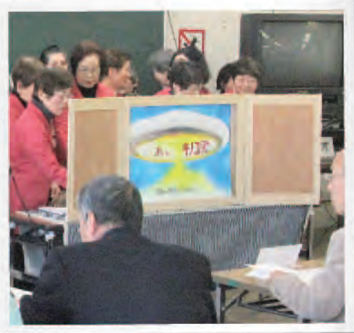
昨年度の公募事業の様子

蒲郡市内のボランティアグループ、市民活動団体及び福祉的な課題に取り組んでいる団体・グループ等の活動の促進と共同募金への理解の拡大を目的に、共同募金の配分金の一部を財源として公募を行い、公開プレゼンテーションによる審査会を経て助成する事業です。