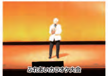
ふれあいカラオケ大会

今年も恒例の福祉まつりが開催されました。当日は天候も良く、多くの参加者が集まり、福祉への関心の高さを感じることができる1日となりました。チャリティバザー収益金は善意銀行を通じて、今後の福祉事業に役立てさせていただきます。