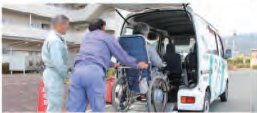
(送迎サービスの様子)

ふれあい蒲郡は在宅介護等でお困りの方や日常生活に支障がある方が「利用会員」になり、地域のなかから参加した「協力会員」が、介護や家事援助サービスを有料で提供する会員制の相互扶助の制度です。