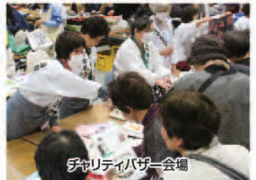
チャリティバザー会場