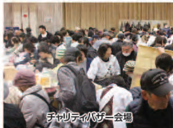
チャリティバザー会場