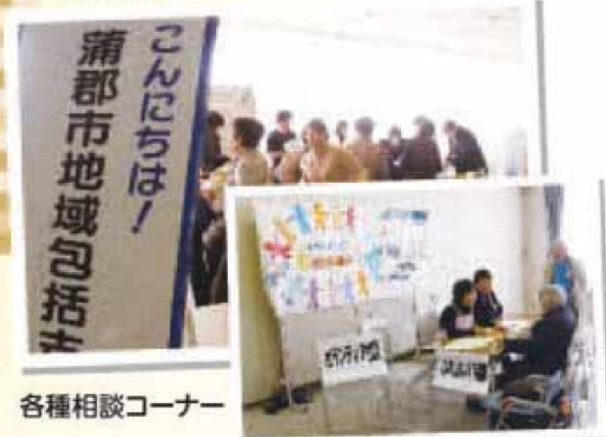
各種相談コーナー