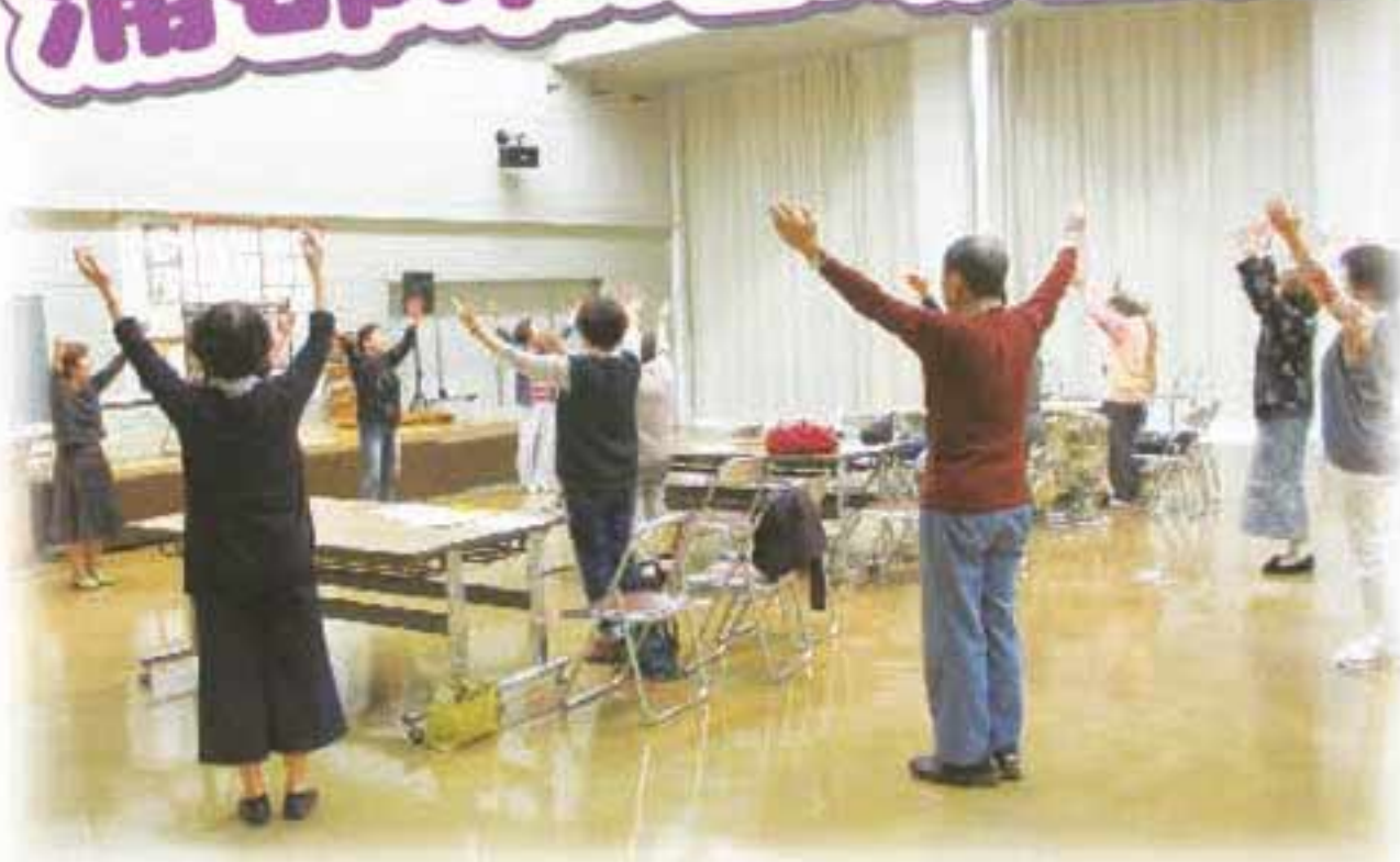
～介護者のつどい～ 「認知症についての講座、予防体操を行いました。」