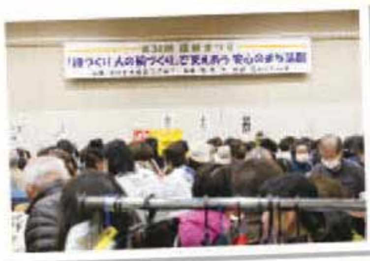
チャリティバザー