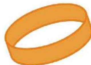
▲認知症サポーターの型「オレンジリング」

地域包括支援センターでは、認知症サポーターの養成活動を行っています。興味がある方、グループで講座を受けてみたい方、お気軽にご相談ください。