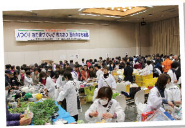
チャリティバザー