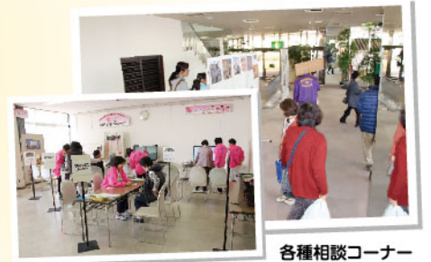
各種相談コーナー