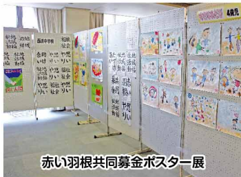
赤い羽根共同募金ポスター展