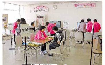
健康相談コーナー