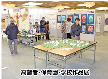
高齢者・保育園・学校作品展

今年も恒例の福祉まつりが開催されました。当日は天候も良く、多くの参加者が集まり、福祉への関心の高さを感じることができる1日となりました。チャリティバザー収益金は善意銀行を通じて、今後の福祉事業に役立てさせていただきます。