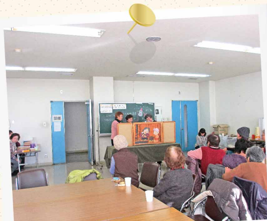
みんなで大型紙芝居を楽しみました (脳の健康教室懇談コーナーにて)