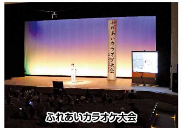
ふれあいカラオケ大会

今年も恒例の福祉まつりが開催されました。当日は天候も良く、多くの参加者が集まり、福祉への関心の高さを感じることができる1日となりました。チャリティバザー収益金は善意銀行を通じて、今後の福祉事業に役立てさせていただきます。