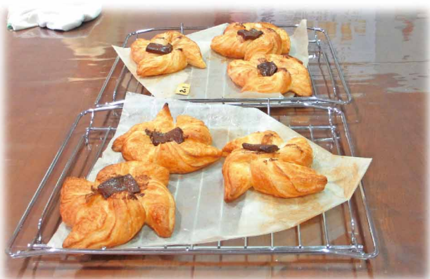
おいしいパンができました(パンづくり体験 安城デンパークにて)

『介護者のつどい』は、在宅で介護してみえる方を中心に、以前介護をされていた方、ボランティアの方々が集まって月1回開催しています。いつでも参加は可能、お気軽にお越しください。