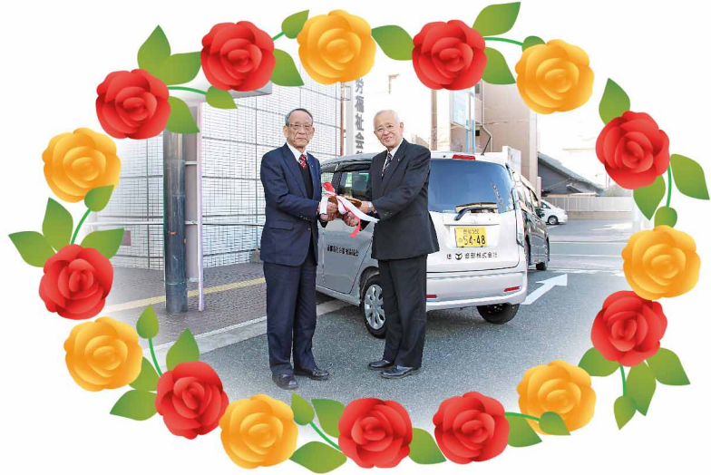
音部株式会社様より、創立65周年記念に伴い、軽自動車を寄贈していただきました。(平成27年2月)