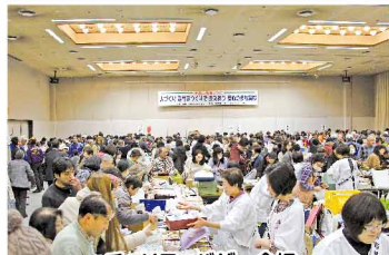
チャリティバザー会場