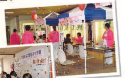
各種相談コーナー