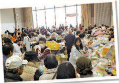
チャリティバザー