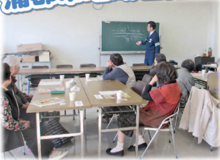
～介護者のつどい～ 蒲郡市の交通事故発生現状について学びました