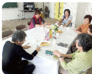
生活支援グループ