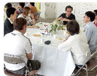
配食サービスグループ