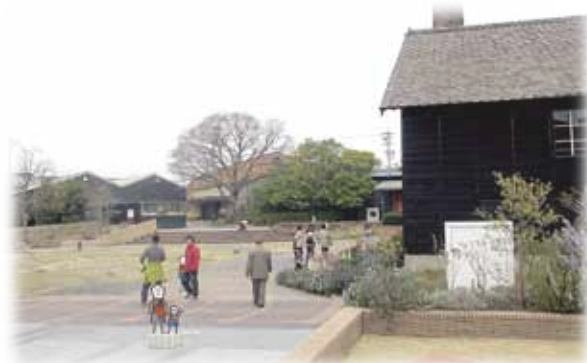
散策する参加者／INAXライブミュージアムにて

今年も行ってきましたバス旅行、「INAXライブミュージアム」みんなで楽しく春を満喫してきました。『介護者のつどい』は、在宅で介護してみえる方を中心に、以前介護をされていた方、ボランティアの方等々…が集まって月1回開催しています。いつでも参加は可能、お気軽にお越しください。