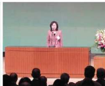
蒲郡市民憲章 三つの誓い 唱和