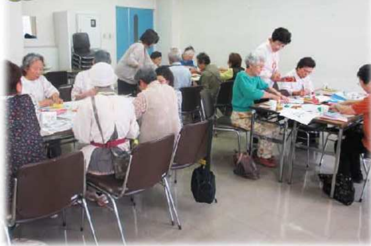
～介護者のつどい～ 折り紙での色紙づくり夏の飾り物