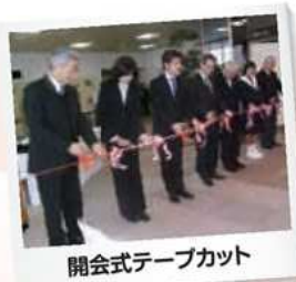
開会式テープカット