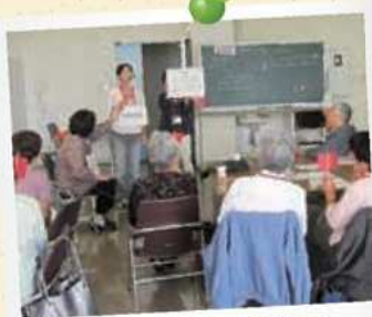
懇談コーナーの様子