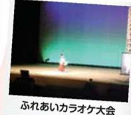
ふれあいカラオケ大会