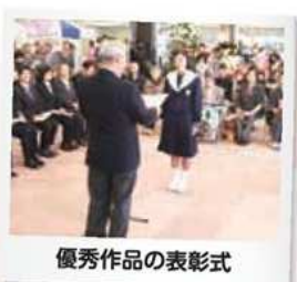
優秀作品の表彰式