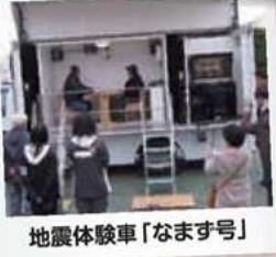
地震体験車「なます号」