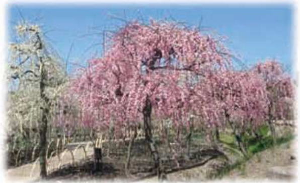
しだれ梅を撮影する参加者／なばなの里にて

『介護者のつどい』は、在宅で介護してみえる方を中心に、以前介護をされていた方、ボランティアの方等々が集まって月1回開催しています。いつでも参加は可能、お気軽にお越しください。