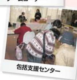
包括支援センター