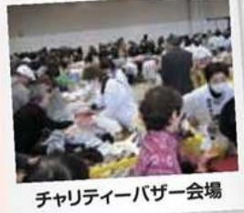
チャリティーバザー会場

今年も恒例の福祉まつりが開催されました。多くの参加者が集まり、福祉への関心の高さを感じることができる1日となりました。チャリティーバザー収益金は善意銀行を通じて、今後の福祉事業に役立てさせていただきます。