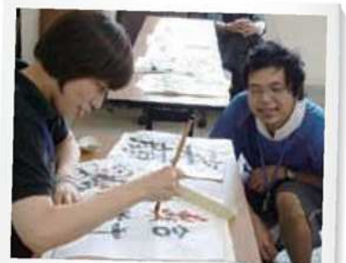
23年度 習字教室の様子

心の病や障がいがあることで、社会参加したくてもできない… そんな方々に向けて、気軽に出かけてもらえるような講座を企画しました。 参加をご希望の方は当センターまでお気軽にご連絡ください。