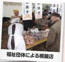
福祉団体による模擬店