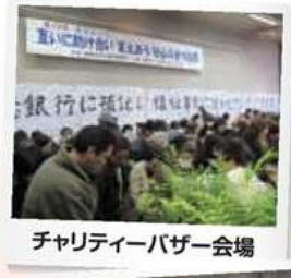
チャリティーバザー会場