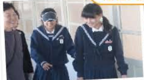
盲人ガイドヘルプ 体験のようす