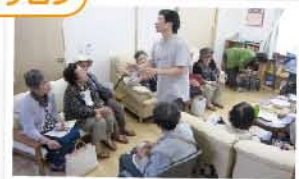
H23.6.9「おたのしみ会」 形原眺海園「めくもりの家」 施設見学のようす