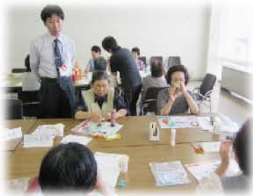
6月 介護者のつどい~万華鏡作り~