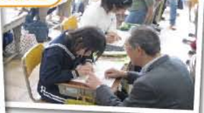
H23.2.16 形原北小学校にて 点訳体験のようす