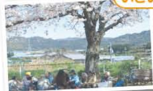
H23.4.7「いこい会館へ行こう」 大塚町 老人ホームでお花見のようす