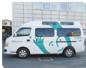
日本財団から助成を受けた福祉車両

調理、衣類の洗濯、住居等の掃除、買い物、子育て支援、送迎サービス、配食サービス等