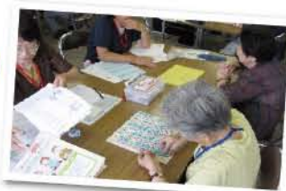
H22.9.3 勤労福祉会館にて学習室のようす