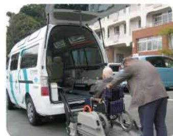
送迎サービスの様子