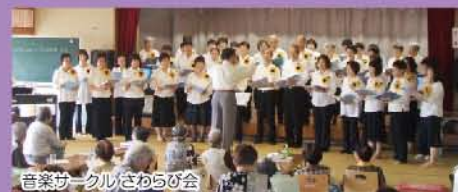
音楽サークルびざらび会