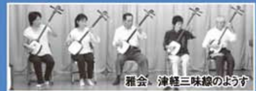
雅会、津軽三味線のようす

寿楽荘では水曜日の【ふれあい入浴の日】に大広間の舞台上、皆様方の趣味を活かした演奏会の開催や特技等の披露を希望されるボランティアさんを募集しています。多数のボランティアさんのご連絡をお待ちしております!!