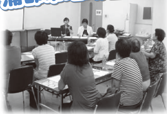
地域の皆さんと勉強会～認知症サポーター養成講座にて～