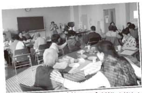
クリスマス会を楽しむ皆さん

この「おたのしみ会」は、勤労福祉会館を拠点として、昨年6月から毎月第2木曜日の午前中に開催しています。介護予防の話、パズルづくり、施設見学など毎月趣向を凝らした内容で参加者にも大人気。12月にはクリスマス会を開催し、手づくりホットケーキなどを食べながら、楽しいひとときを過ごしました。