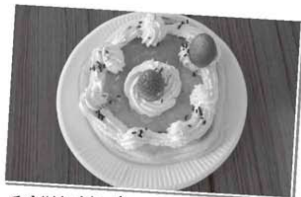
手づくりホットケーキ

介護予防の一環として、参加者とボランティアが共同で内容を決め運営し、楽しい仲間づくりの場となっている いきいきサロン を社協は応援しています。