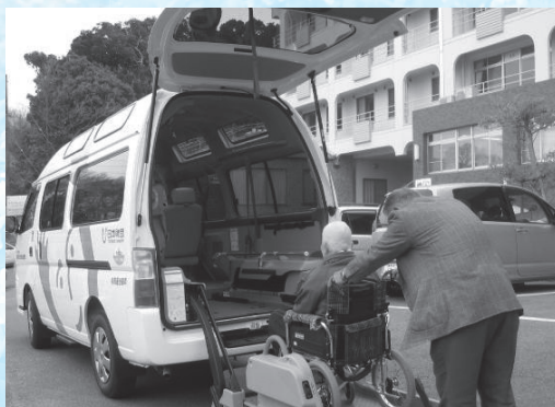
送迎サービスの様子

調理、衣類の洗濯、住居等の掃除、買い物、子育て支援、送迎サービス、配食サービス等