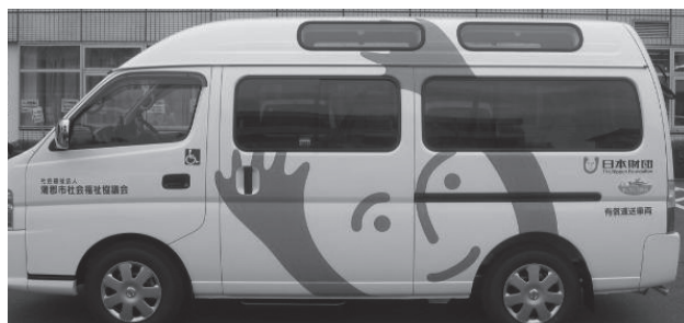
日本財団から助成を受けた福祉車両

(送迎サービスの利用料金は距離によって異なります) ※時間外についてもご相談に応じます。