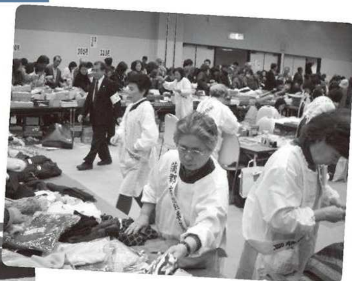
チャリティーバザー会場▲