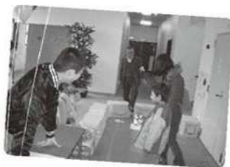
ボーリングゲーム▲