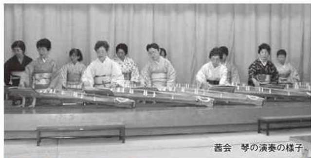
昔会 琴の演奏の様子