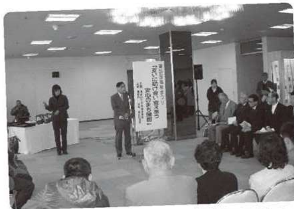
福祉まつり開会式▲

福祉団体による模擬店、チャリティーバザーをはじめ、カラオケ大会、福祉茶会、高齢者、障がい者作品展などに多くの方々がご来場くださり、盛大なうちに終わることができました。なお、市民の皆様からご提供いただきました物品はチャリティーバザーで販売し、その収益金1,419,092円は善意銀行を通じて、今後の福祉事業に役立たさせていただきます。