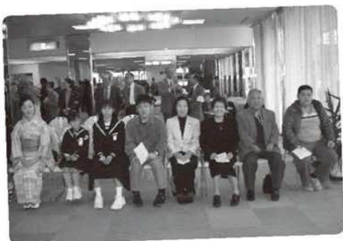
福祉まつり表彰者▲