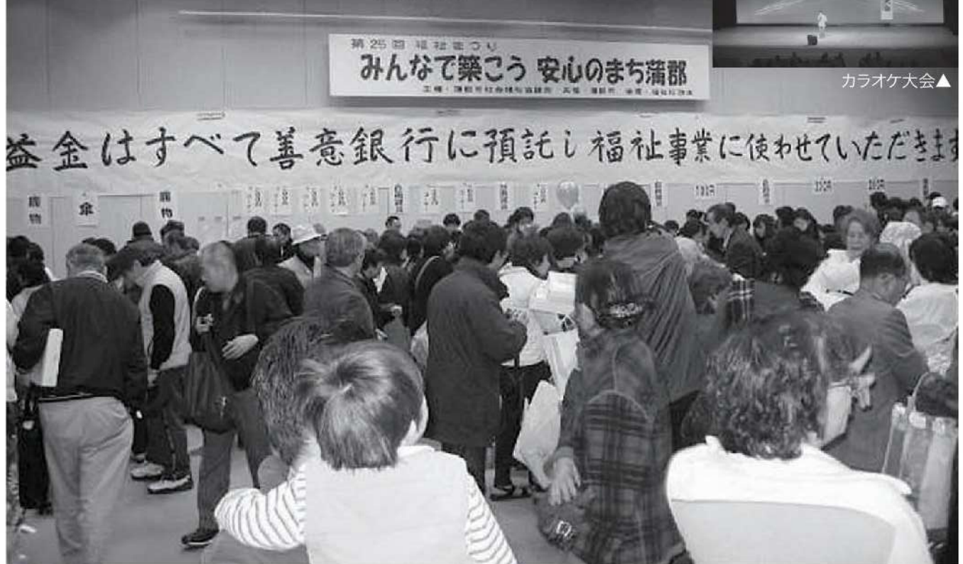
チャリティーバザー会場▲