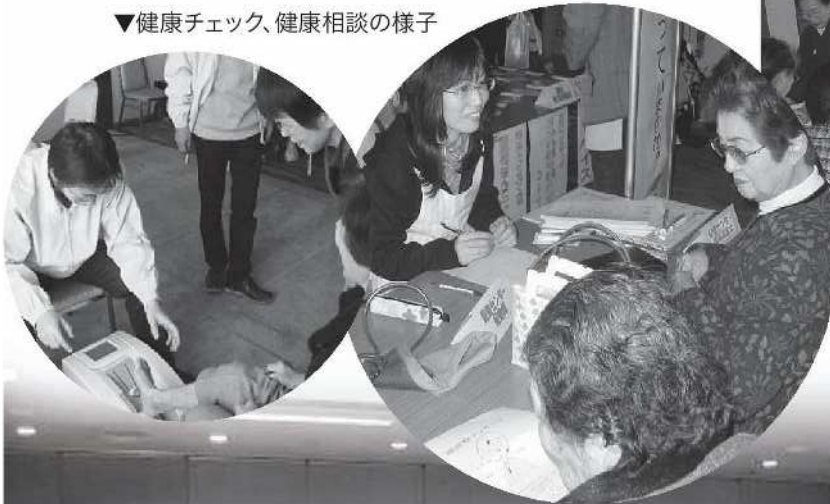
▼健康チェック、健康相談の様子