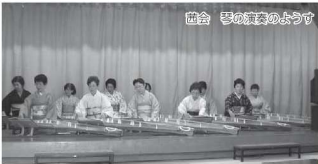
碁会 碁の演奏のようす

寿楽荘は、市内在住の60歳以上の皆さんの健康づくりの場、生きがいづくりの場、友達づくりの場として、無料送迎バス(2台)を市内一円に運行させ、一日楽しく過ごしていただく事業を行っております。