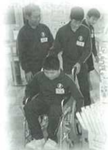
平成18年11月30日(木)蒲郡中学校福祉体験の様子

今年度もそれぞれ手話・点訳・車椅子・ガイドヘルパー・要約筆記・朗読の6講座をボランティア派遣講師30名で行いました。