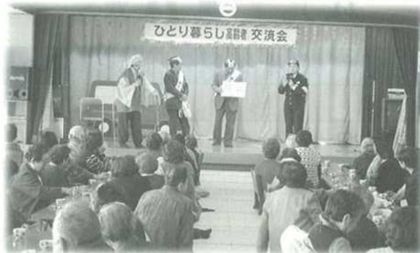
県警交通安全教育チームによる楽しい啓蒙劇

平成18年11月28日(火)・30日(木)・12月1日(金)の3日間老人福祉センター(寿楽荘)にて招待高齢者311人が参加。入浴したり、おいしい食事をしながら、楽しい歌・踊り・弾き語りを楽しみました。 民生委員・ボランティア等62名がお手伝いをしました。