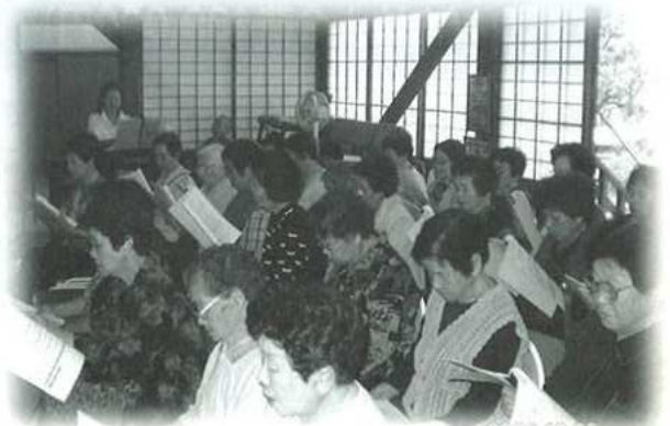
10月5日(木)形原6区「むつみ会」専称寺 歌会