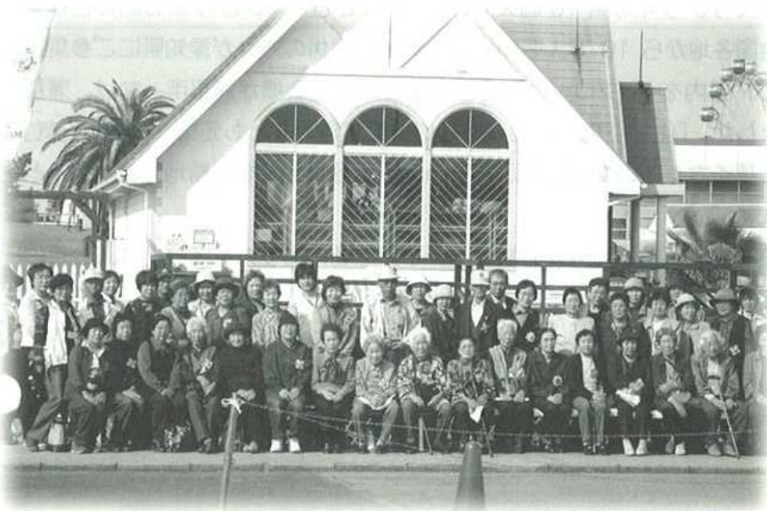
11月1日(水)西浦地区「公民館へ行くか〜ん」バス旅行 南知多ビーチランドにて