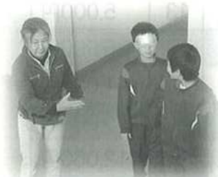
平成18年12月15日(金)三谷小学校福祉体験の様子