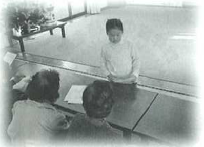
▲東大塚・相楽いきいきサロン 平成18年12月16日(土) クリスマス会(いこい会館にて)