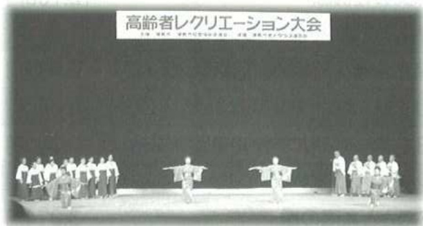
高齢者レクリエーション大会

平成18年11月6日(月) 市民会館大ホールにて市内11地区の老人クラブ・寿楽荘民謡クラブ・大塚老人ホーム入所者の方々による歌と踊り45題目を披露。 この日は一年間の練習の成果を十二分に発揮!! 総勢1,200名。