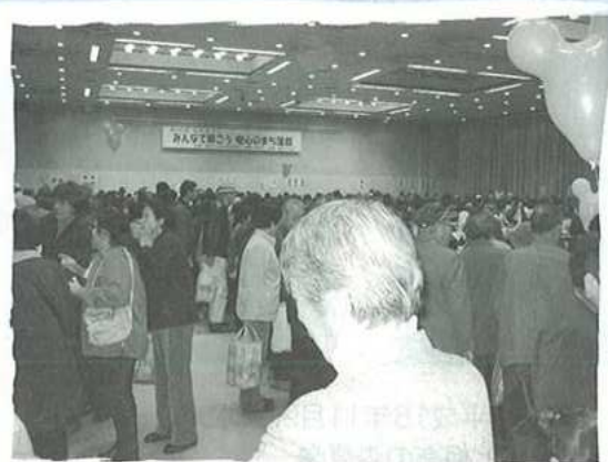
笑顔がいっぱいチャリティーバザー