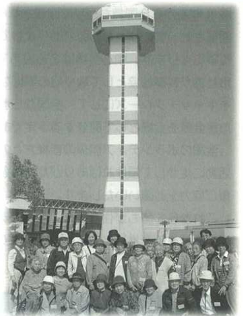
10月13日(金)形原地区「みんなおいでん」 バス旅行 木曾三川公園にて