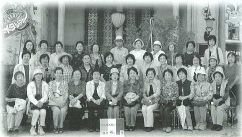
9月15日(金)蒲郡地区「楽々サロン」バス旅行 イタリア村にて