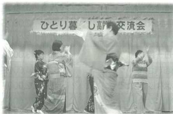
三喜社中の皆さんによる日本舞踊