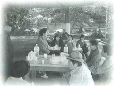
▲西大塚いきいきサロン 平成18年11月9日(木) 一般廃棄物最終処分場と相楽の森見学