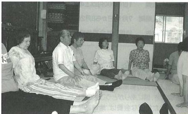
H18.6.28 府相地区いきいきサロン開催「リラックス体操」の様子