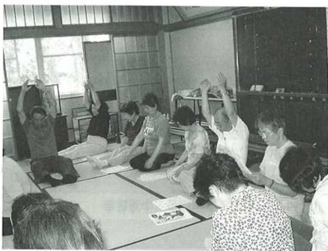
平成18年6月28日開催 府相地区「リラックス体操」南部市民センターにて