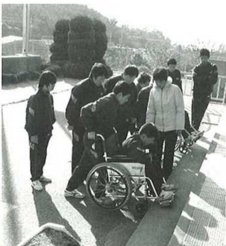
H18.1.26 三谷中学校福祉体験の様子