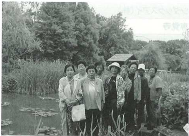
平成18年6月8日開催 形原6区地区野外活動 豊橋動植物公園「のんほいパーク」にて