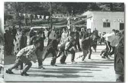
3時のおやつだよパン食い競走!

相楽町「さがらの森」にて秋晴れのもと、障害者、高齢者を交え、合同運動会を開催しました。朝夕は寒かったにもかかわらず、164名の参加者全員で、灰皿フリスビー投げ、パン食い競走などを楽しみ、交流を深めました。