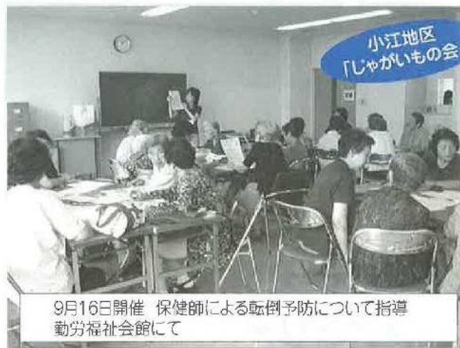
小江地区 「じゃがいもの会」