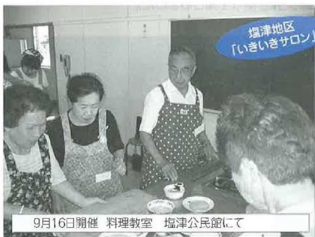
塩津地区 「いきいきサロン」