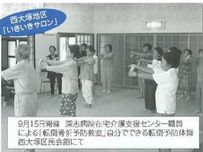
西大塚地区 「いきいきサロン」

9月15日開催 深志病院在宅介護支援センター職員 による「転倒骨折予防教室」自分でできる転倒予防体操 西大塚区民会館にて