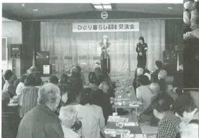
県警交通安全教育チームによる楽しい啓蒙劇

平成17年11月14日(月)・17日(木)・18日(金)の3日間老人福祉センター(寿楽荘)にて招待高齢者334人、民生委員・ボランティア等61名。入浴したり、おいしい食事をしながら、楽しい歌・踊り・弾き語りを楽しみました。