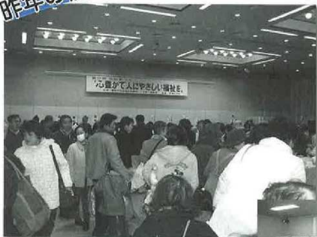
笑顔がいっぱいチャリティーバザー