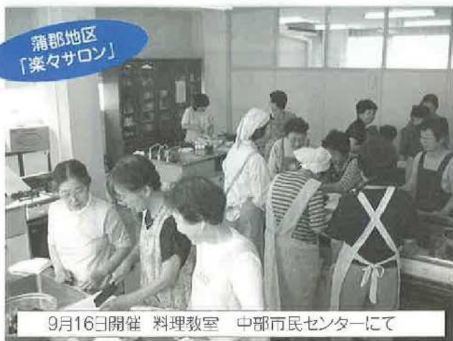
蒲郡地区 「案々サロン」