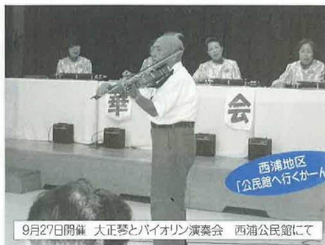
西浦地区 「公民館へ行くがーん」