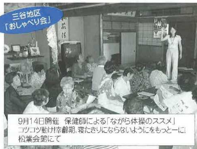
三谷地区 「おしゃべり会」

9月15日開催 深志病院在宅介護支援センター職員 による「転倒骨折予防教室」自分でできる転倒予防体操 西大塚区民会館にて