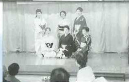
三喜社中の皆さんによる日本舞踊