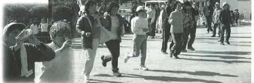
ニアピン灰皿フリスビー投げ競技