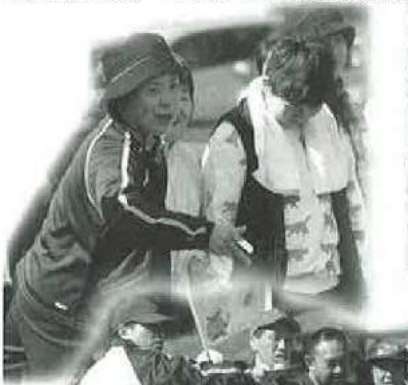
お昼のバーベキュー