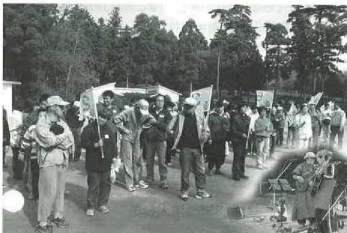
朝の開会式 いまからラジオ体操開始です

相楽町「さがらの森」にて秋晴れのもと、障害者、高齢者を交え、合同運動会を開催しました。朝夕は寒かったにもかかわらず、164名の参加者全員で、灰皿フリスビー投げ、パン食い競走などを楽しみ、交流を深めました。