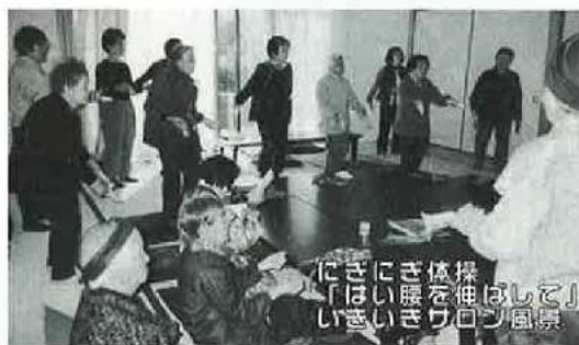
（いきいきサロン活動状況）

「地域での人と人とのつながりを強くしたい。」 こんな思いから始まって、現在では10地区で実施しています。この会は、参加者とボランティアが協力して内容を決めて運営していく楽しい仲間づくりの場となっています。