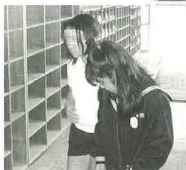
形原北小学校 5年生80名 平成16年12月10日(金)