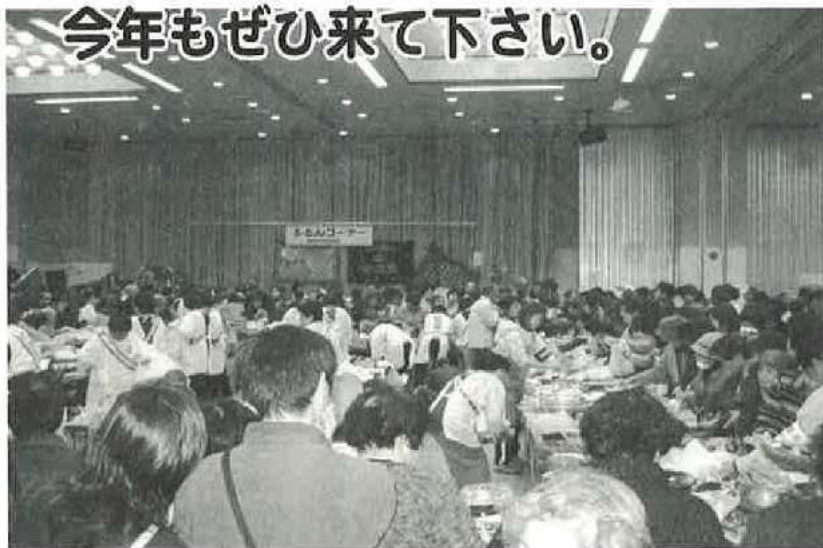
笑顔がいっぱいチャリティーバザー