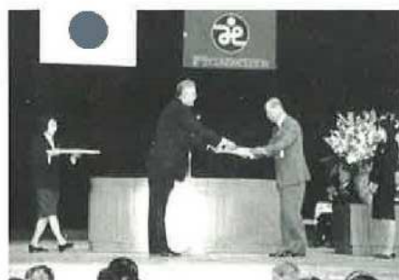
社会福祉に貢献された方々に蒲郡市長・社協会長から表彰状・感謝状を贈呈