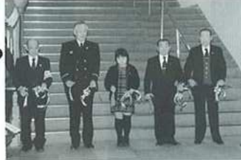
テープカットで福祉まつりが 始まります