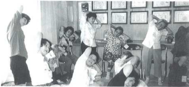
▲形原6区町内会館にて