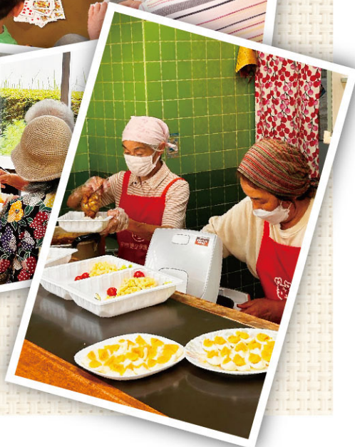
更生保護女性会「キッチンおれんじ」の様子