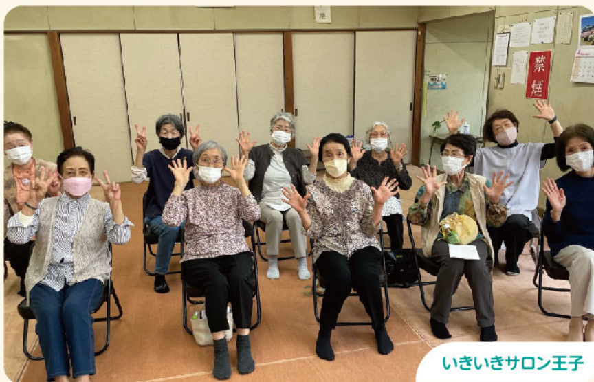
いきいきサロン王子

いきいきサロンとは「地域における仲間づくりやふれあいを通して、介護予防や見守りを行うことを目的とした活動」です。社会福祉協議会では「いきいきサロン」の活動について、運営実績に対する助成を行っています。また、今年度より「いきいきサロン新設準備助成金」ができました。新設についての必要経費18,000円を上限に、1回限り助成いたします。また、令和5年5月31日までに限り、既存活動団体も対象になります。詳しい申請方法・助成内容については社会福祉協議会(TEL/0533-69-3911)生活支援コーディネーターまでお問合せ下さい。