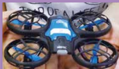
▲ドローン操縦を体験しよう