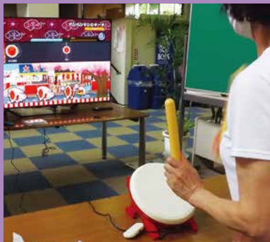
▲eスポーツを楽しもう 太鼓の達人