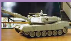
▲ラジコン戦車で遊ぼう

寿楽荘は、市内在住の60歳以上の皆さんが、一日楽しむ過ごす場所を提供しています。