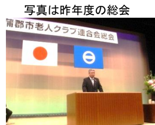
写真は昨年度の総会

蒲郡市民会館に於いて、26年度の蒲郡市老人クラブ連合会総会が開催されました。この席にて、今年度は4名の地区会長・役員が感謝状を授与されました。