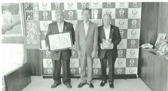
蒲郡市長への報告訪問