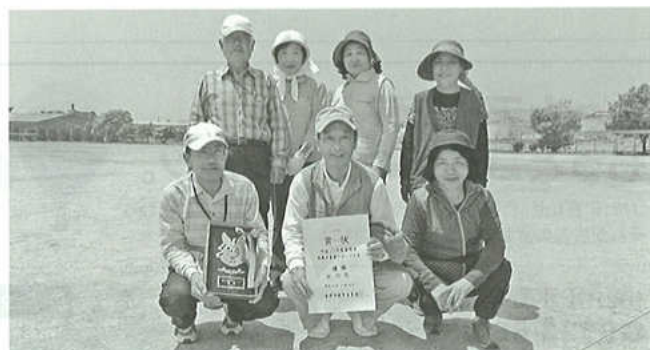
春大会優勝の形原南チーム

秋とはいえ、朝から汗ばむ陽気のなか、大塚地区からも浜町グランドに選抜選手26人が出場。結果は、幸運にも恵まれ春季5位に関らず年間総合優勝をすることができました。今回の内訳は、輪投とホールインワンが優勝、Gゴルフとペタンクが2位、残念ながらゲートボールは等外。これは、日ごろの練習の成果とチームが一丸となり精一杯頑張った無心の勝利だと思っています。優勝カップ、盾、賞状は町民の多くが集まる公民館のロビーに展示し地区への報告としました。なお、昨年度は春季に優勝をしたものの秋季は不調で総合3位で、今回はその雪辱を果たした事になります。(大塚チーム代表)