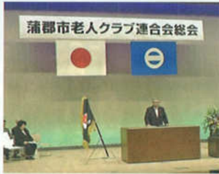
連合会長あいさつ

※8月30日に開催された愛知県老人福祉大会に於いても5名の方は表彰を受けました。