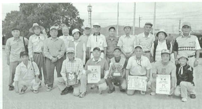
秋大会優勝・総合優勝の大塚チーム