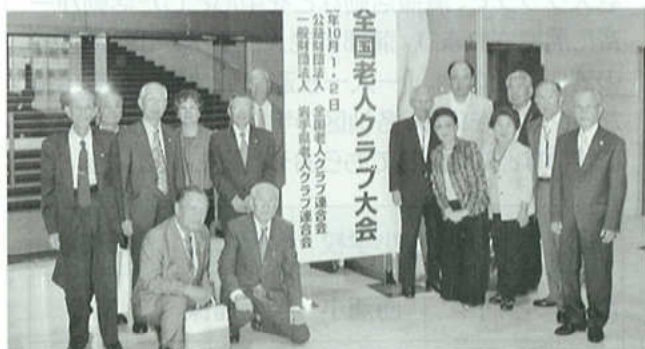
愛知県から参加の各市町の会長

10月1日(火)・2日(水)に岩手県盛岡市の岩手県民会館に、全国から1500名の会員が集い、全国老人クラブ大会が開催されました。愛知県からは14名の市町村老連会長が参加いたしました。この大会に於いて、蒲郡市老人クラブ連合会は、日々の活動に功績を称えられ「優良老人クラブ」として、全国老人クラブ連合会会長より表彰をいただきました。