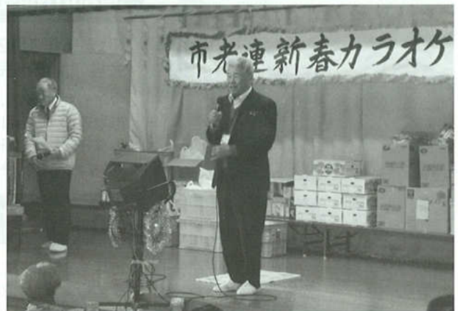
平成26年1月7日開催の新春カラオケ大会