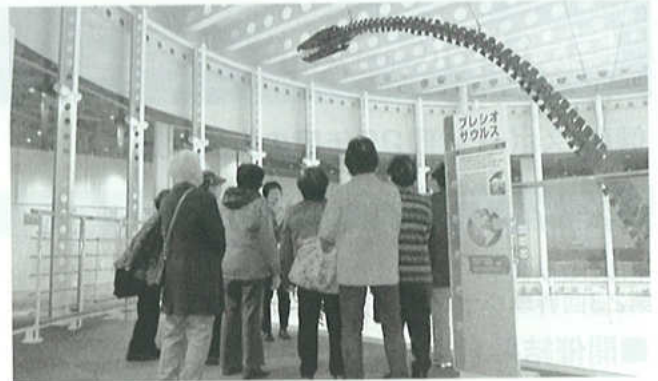
生命の海科学館での見学