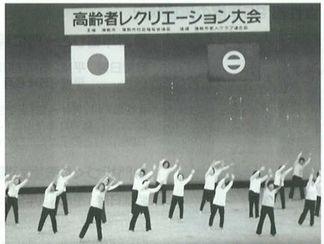
11月8日(金)開催された、高齢者レクリエーション大会

例年より最後まで、声援拍手が多かったと思う。自分たちの地区の出演が済むと帰る傾向に歯止めとしたい。声援には声援でおかえしを!最後に役員諸氏には、年に一度の発表の場、時間に捉われず、追われずに裏方の部員たちの懸命の努力へ労いを願います。昨年はいろいろとありがとうございました、良き日々の新年であります事を願います。