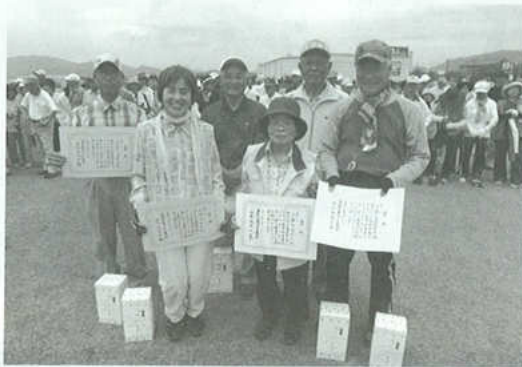
第23回グランドゴルフ大会上位入賞者