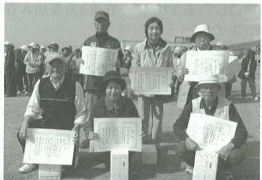
第24回グランドゴルフ大会上位入賞者