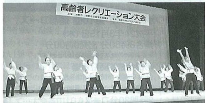
高齢者レクリエーションで大活躍の女性部