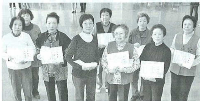
女性部健康体操皆勤賞の皆さん(22年度3月)

冬にはいただいたシーツの端切れを三つ編みにし、クルクルと巻いた座布団と、もう一つは割りばしを使った壁飾りを作りました。今年の冬は牛乳パック椅子と壁掛け布ぞうり飾りを作り、市民会館に展示されました。大変みんなに好評でした。みんなでいろいろ作るの楽しいですね。