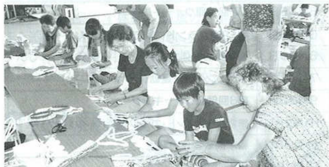
夏休みの小学生親子との布草履教室