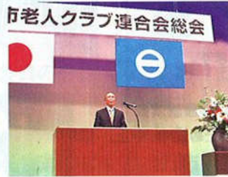
連合会長あいさつ

※8月31日に開催された愛知県老人福祉大会に於いても6名の方は表彰を受けました。