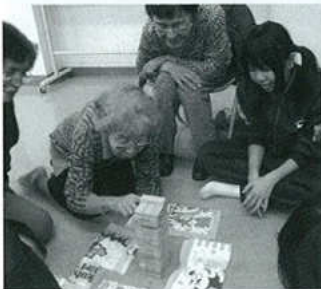
三谷中とのふれあい活動

明日へと導く事の出来る、若手加入者を迎える為にも、心を広く柔らかく持って! ウェルカム!