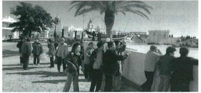
地元ラグーナをみんなで見学

これからも高齢化が進み、人生80年、90年、100年となり、老人パワーが社会で必要不可欠の時代がやってきます。まだまだ人生これからであります。多くの方々が大塚老人クラブに入会して楽しみながら健康管理に励んでいただきますようお願いいたします。