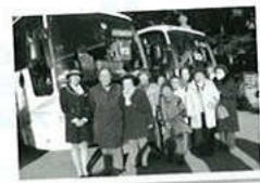
熱田神宮初詣(22年1月)