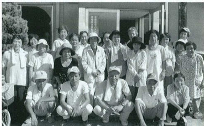
北部ウォーキング