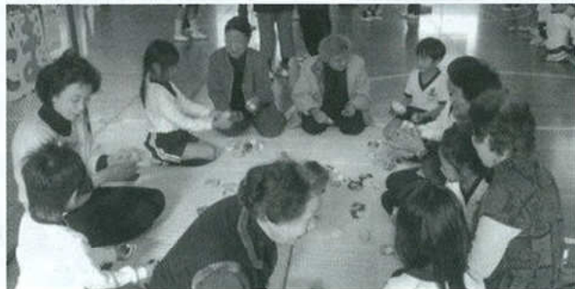
小学生とのふれあい

最後にかつてからあった会が解散した時のようにならない為に、今話し合い、知恵を出し合い、時代に合った老人会を作らなければならないと思うのです。