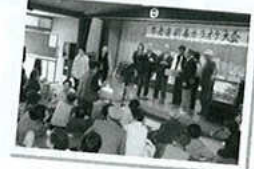
新春カラオケ大会(22年1月)