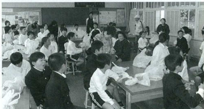
西浦小学校での布ぞうり教室

朝起きてみるとまたよい天気、朝の食事もまたよい料理。温泉ともお別れ、バスに乗り込み、見送られ、鳴門公園六鳴門大橋見学と昼食を取り、写真を撮り、次には岩屋港に行きフェリーにりましたが、うず潮の回るのは見る事ができませんでした。それでも楽しい旅行が出来ましたことは蒲郡市老人クラブに入り、みな仲間と旅できたおかげだと思います。