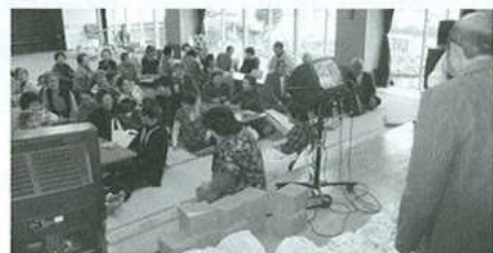
寿楽荘でのビンゴ大会