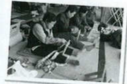
女性部物作り教室