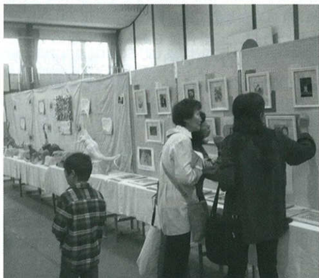
北部公民館まつりにて

最後になりましたが、新会員の増加を計り、今後益々この会が繁栄することを念じてペンをおきます。