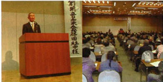
連合会長あいさつ