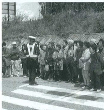
警察署員を招いて交通安全教室

「仲間づくり」をクラブのテーマに、活動の結果、今年は13名加入していただきました。