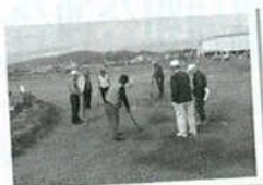
秋季グランドゴルフ

これらは蒲郡市老人クラブ連合会としての年間行事を一部抜粋しております。 また地域毎に、その他いろいろな活動を展開しております。