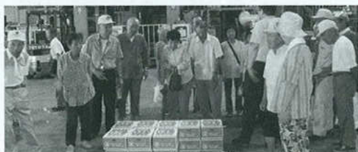
蒲郡みかん選果場見学

1月5日には氏神さんの赤日子神社で長寿祈願祭を行い、宮司さんのお祓いを受け一年間無事に過ごせるようにお祈りします。またレクリエーション的な楽しみとして、年間寿楽荘へ四回、豊川ふれあいセンターに二回、ひじり会としては3月に三河温泉にてお風呂に入り、芝居を見たり、昼食にはお酒も出て親睦をはかります。以上のような事で会員になればいろいろ楽しみがあると思いますが、農家の人が多く、皆さん忙しい毎日を送っておりますので、新加入者が出来ず苦勞しております。本年よりひじり会の会長ということになりましたが、何の自信もありません。会員の皆さんのご協力によりなんとか勤めたいと思います。また市老連の役員の方の指導を受けながらこの役を続けて行きたいと思っておりますので、今後ともよろしくお願ひします。