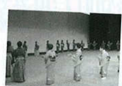
高齢者レクリエーション