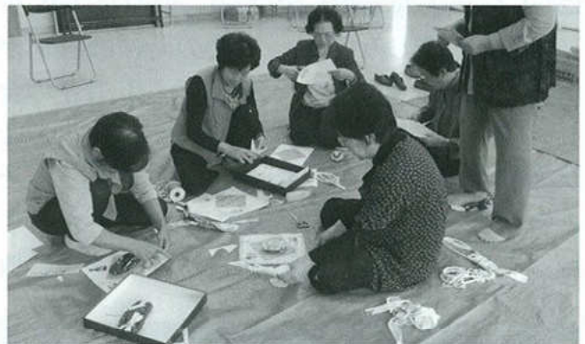
形原女性部 布ぞうり作り