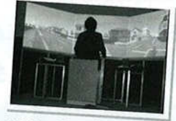
交通シュミレーション