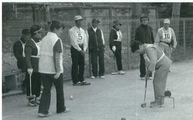
北部地区グランドゴルフ大会