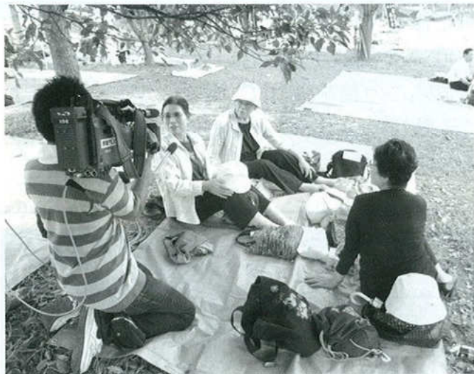
県スポーツ大会で東海テレビにインタビューされました