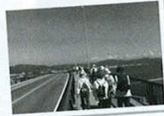
形原ウォーキング