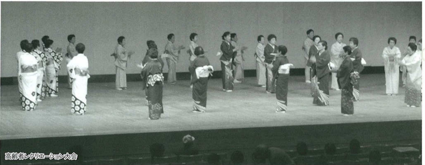
高齢者レクリエーション大会