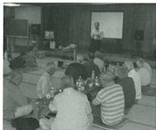
交通安全の講和を受ける会員