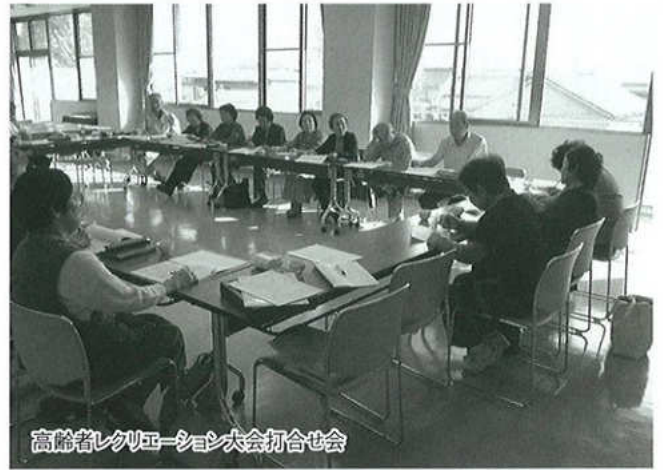
高齢者レクリエーション大会打合せ会