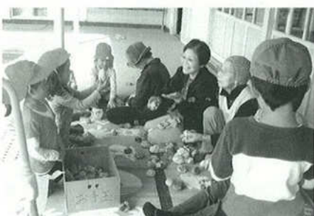
保育園児とのふれあい活動

本会の望みは、若い会員が増え、平均年齢の若返りです。会員資格は60歳以上ですので、町内の多くの方々の入会を希望しています。