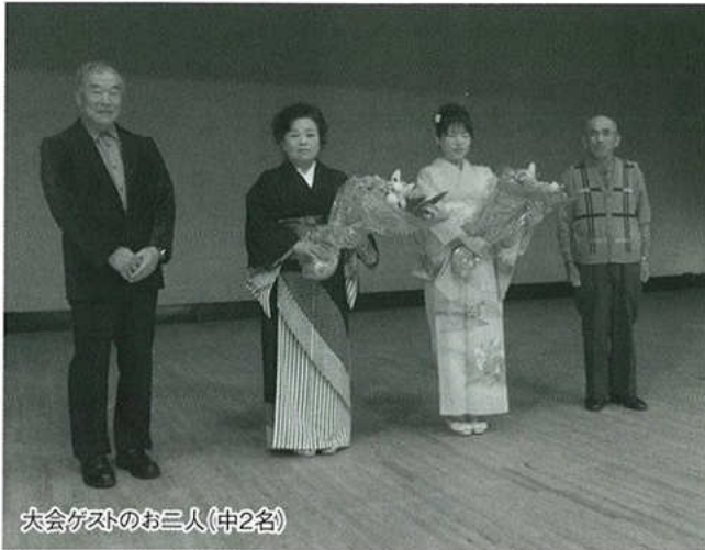
大会ゲストのお三人(中2名)

事務局の方々のご援助、ご協力により無事終える事が出来ましたことを感謝申し上げます。