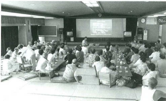
脳卒中の話しを真剣に聞く