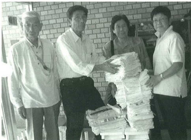
9月20日 全国社会奉仕の日 市内保育園小中学校へ配布

※配布枚数基準は(クラス数×11枚)前後とし配布 残りは福祉施設(寿楽荘44枚・眺海園180枚)へ寄付する。