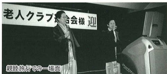
親睦旅行での一場面

私は中央小学校の見守り隊を始めてから三年になります。登校日は毎朝七時三十分頃から生徒と共に歩いていきます。自分の運動になり父兄からも喜ばれ、先生方にも感謝され見守り隊になってよかったと思います。これからも健康である限りは続けて行きたいと思っています。