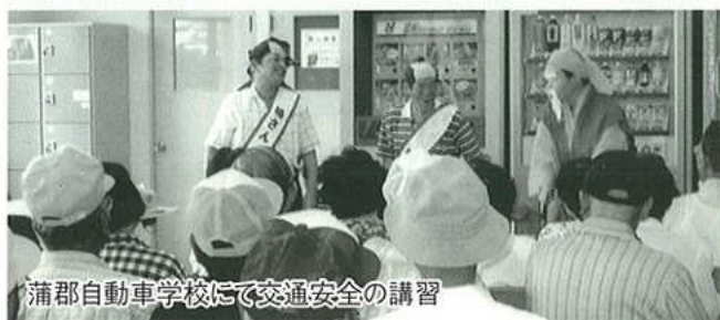
蒲郡自動車学校にて交通安全の講習