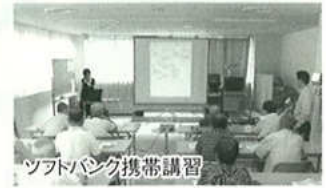
ソフトバンク携帯講習