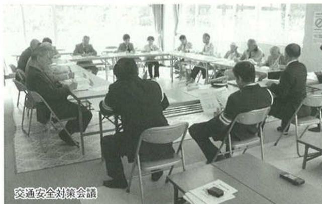
交通安全対策会議

自転車にはほぼ毎日買い物他に乗り、又自動車には週に2~3日は運転しますが、それぞれの立場で考えさせられます。