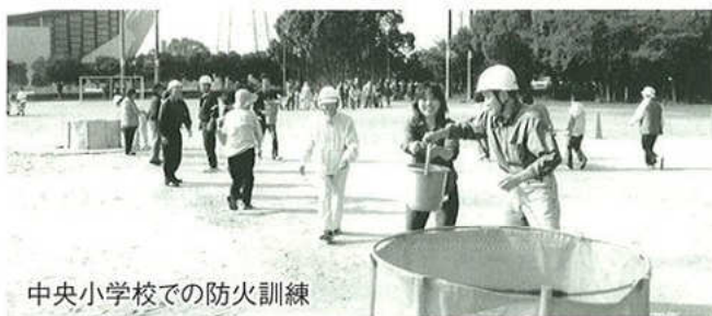
中央小学校での防火訓練