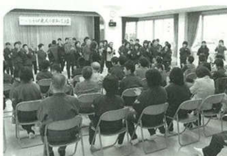
三谷中学生とのふれあい交流