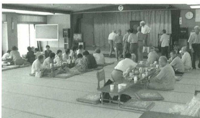
ニュースポーツに挑戦!(ダーツ大会)