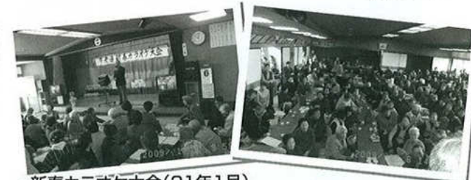
新春カラオケ大会(21年1月)