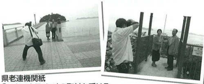
県老連機関紙「いきいきライフ」の取材を受ける