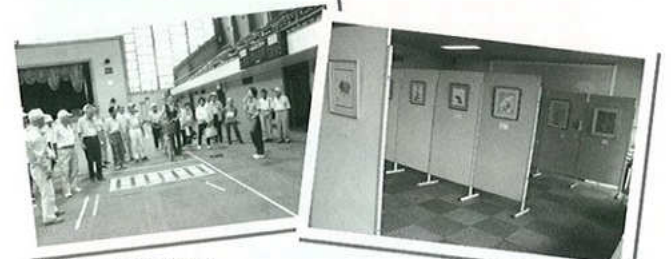
蒲郡市自転車大会