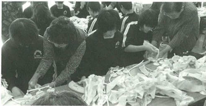
中学校での布ぞうり教室

会員皆がますますの絆を深め、健康に十分気をつけ、悠々会を盛り上げ、がんばって行きたいと思います。