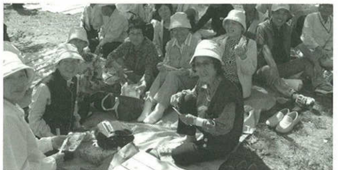
みんなで県スポーツ大会応援に!