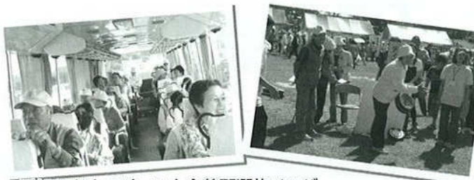
愛知県老人スポーツ大会蒲郡選抜メンバー