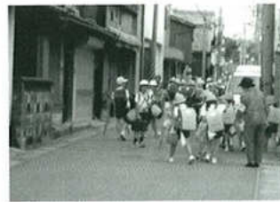
登下校時のミニパトロール