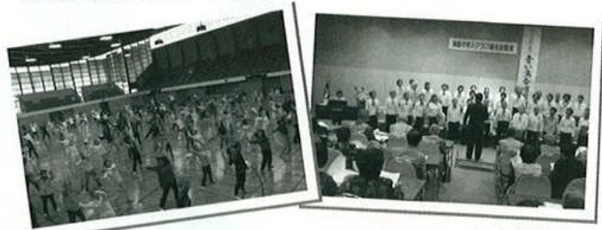
市民ラジオ体操の集いに参加