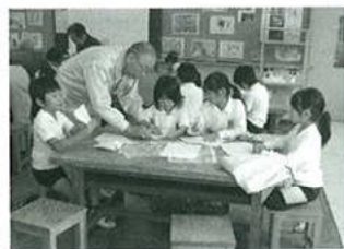
形原小 むかしあそびチャレンジ

また人の為に尽くす事の尊さと喜びを誇りにも思っています。参加して頂く会員も年毎に足腰が弱まり補充に頭を痛めますが、若い会員の募集に努力して、皆様のご支援を得ながら後世に引き継いでいく事に意義があると思ひます。