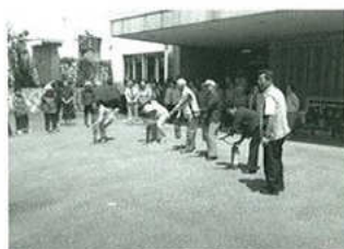
寿楽荘での消防訓練に参加