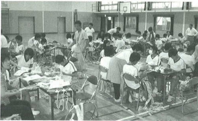
東部小学校との布草履教室