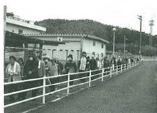
みんなで歩こう健康づくり大会

色々のご意見等あろうかと思われま。高齢化社会に深い関心を持つ方は大勢おられると思えます。ご助言ご指導よろしくお願ひします。