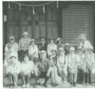
親睦旅行の一コマ・熱田神宮