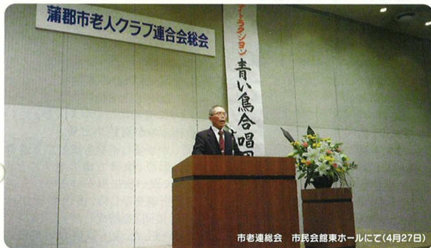
市老連総会 市民会館東ホールにて(4月27日)

老人福祉センター寿楽荘 蒲郡市大塚町山ノ沢13-14 TEL.&FAX 0533-59-7411 ●発行/蒲郡市老人クラブ連合会 教育課