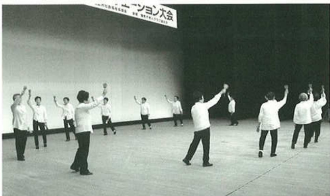
▲今年もお披露目「ぎよしのソーラン節」