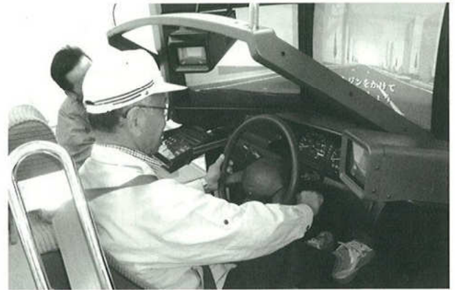
▲シュミレーターによる測定を受ける参加者

3人1組が教習車1台に乗車、「交差点の右折・左折、見通しの悪い交差点の速度や安全確認、一時停止場所での停止・停止線超え」など9項目のチェック診断を教官から受