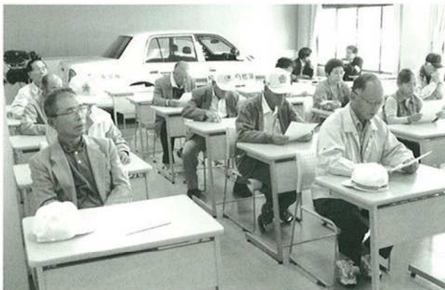
▲ドライバー体験型講習会(蒲郡自動車学校)

ホーンをしている状況と同じようにレーシーパーを付けて自転車に乗り、自動車はどこまで近づいたら気がつくか、又、年齢を加えると動きが緩慢になる横断歩行トレーナーの横断実践などを行いました。9割以上の方々が困難と感じて帰ってきました。