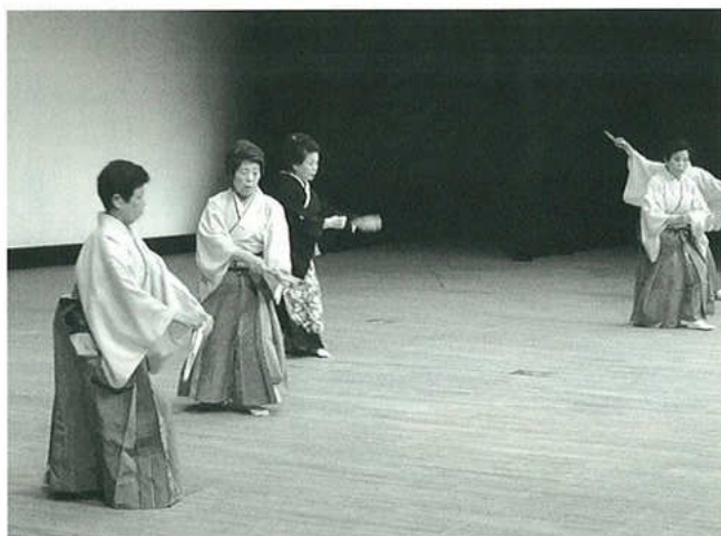
高齢者レクリエーション大会(11月9日)市民会館大ホール