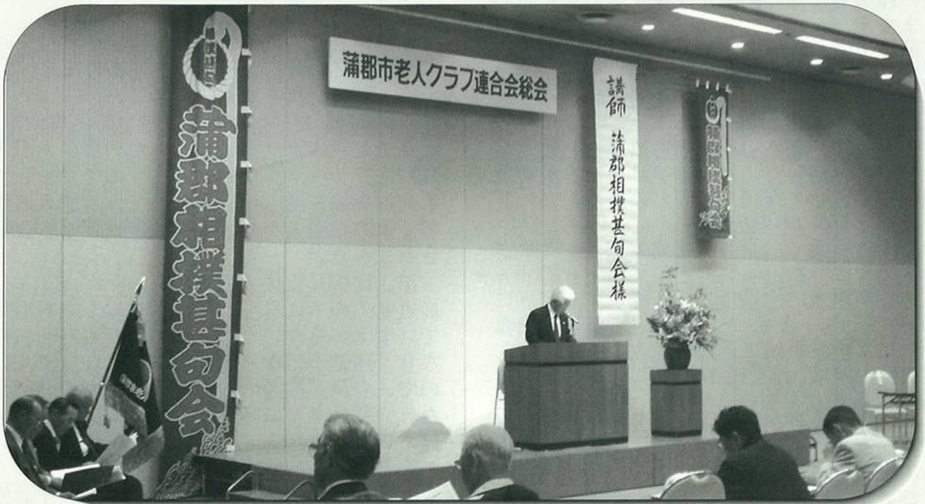
市老連総会 市民会館東ホールにて(4月26日)