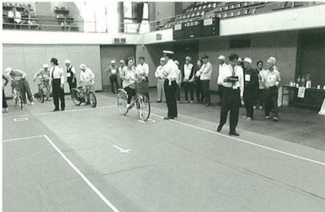
▲高齢者交通安全自転車大会

ホーンをしている状況と同じようにレーシーパーを付けて自転車に乗り、自動車はどこまで近づいたら気がつくか、又、年齢を加えると動きが緩慢になる横断歩行トレーナーの横断実践などを行いました。9割以上の方々が困難と感じて帰ってきました。