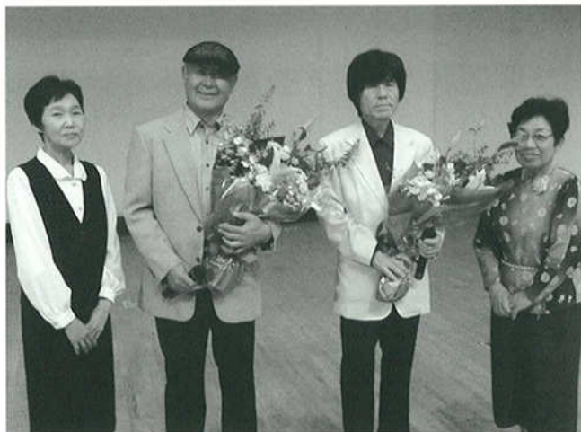
▲高齢者レクリエーション大会ゲスト出演者に花束

府相の民踊クラブを、次の歌紹介して注意を受けてパニック状態へ。「済みません、ごめんなさい、のマイク。女性部の健康体操でも前日確かめた曲で無く、寸前に聞いた曲でも無いとの注意。お楽しみ歌謡ショーも、針の筵です。最後の蒲郡音頭もテープと思いきや、個人が唄う…と、知らぬは私ばかりでし