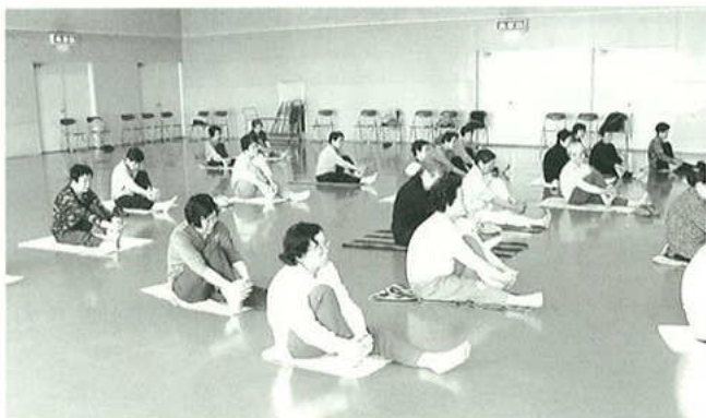
▲週1回のストレッチ(福祉会館)

その状況を見ると私たち女性部でもがんばって作り、福祉まつりなどで売れば絶対に売れるように思えました。