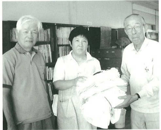
▲「全国社会奉仕の日」(9月20日)市内保育園、小・中学校へ雑巾配布

9月20日 全国社会奉仕の日 蒲郡市老人クラブ連合会では「一人一枚運動」と題し、タオル（雑巾）を提供し、市内の保育園、小学校、中学校への配布をいたしました。