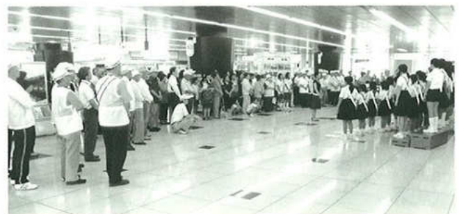
▲秋の交通安全キャンペーン(JR蒲郡駅構内)

また、反射シール等により歩行中や自転車運転中であることを知らせて交通事故に遭わないようにしましょう。