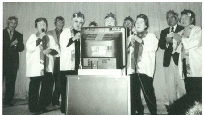
▲毎年2月に行われて居る「川東ファミリー演芸会」に出演された川東悠和会々員の皆さん

会員皆様方の御理解御協力心より感謝御礼申し上げます。高齢者の皆様方の入会をお待ちして居ります。