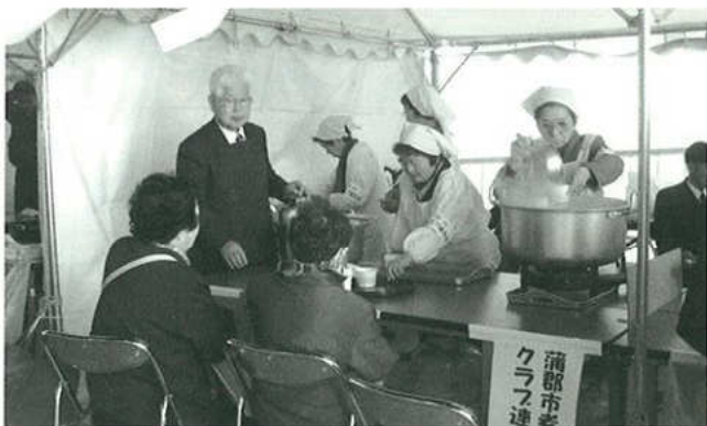
▲福祉まつり模擬店

十一月に行われた高齢者レクリエーション大会においては、午前中は健康講演会を聞き、その後のアトラクションでは、女性部の踊りや、各地区から選ばれた人々のカラオケ・民踊・舞踊など皆さん張り切って参加しました。また三月に行われる福祉まつりにおいては、五平餅とお汁粉を作り、販売いたします。