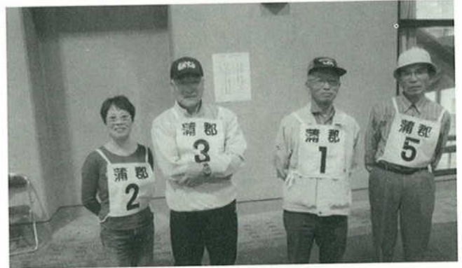
交通安全高齢者自転車愛知大会(10月23日) 三谷地区選手の皆さん

私達も十分自覚して交通安全には心がけて、交通事故の被害者、加害者にならないようにしたいものです。