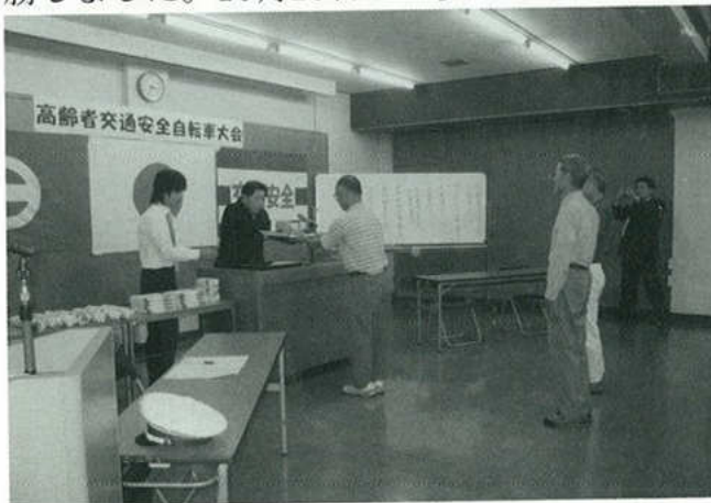
蒲郡市高齢者交通安全自転車大会表彰式(10月3日)

6月15日には蒲郡自動車学校に於いて、交通安全の講習が開催されました。又10月3日には蒲郡体育センターに於いて、市内高齢者自転車競技大会が挙行され、三谷B組が団体優勝しました。10月23日には愛知県下高齢者