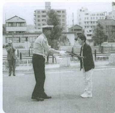
春の交通安全キャンペーン(7月12日) 警察署長より女性部へ感謝状受賞

と人との会話がはずみ、出会いがあり、呆け防止にもつながり楽しく元気に毎日が過ごせるのではないかと思います。