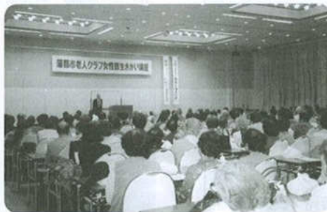
市老連女性部生きがい講座(10月13日) 市民会館東ホール 参加者240人

H16年度 女性部健康教室参加人数 4月108人・5月103人・6月82人・7月107人・8月77人・9月77人・10月94人・11月66人