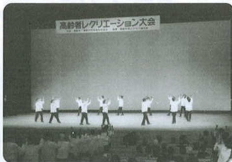
女性部90人による「居酒屋サンパ」(11月11日)

した。毎日の生活の中で感謝の気持ち忘れず、元気で楽しく生きて行ける様に頑張ってください。