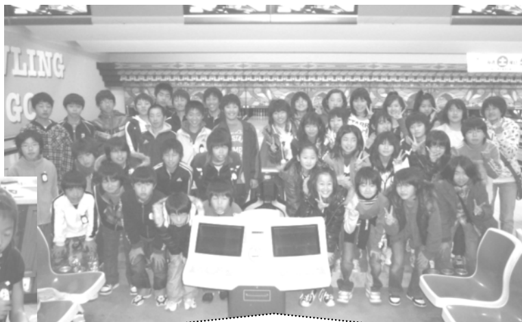
ボーリング大会 よい思い出になりました