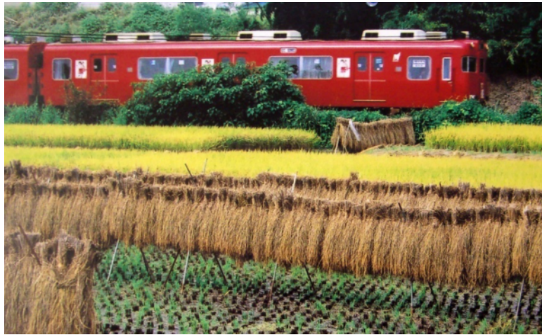
秋の田の中を走る赤い電車