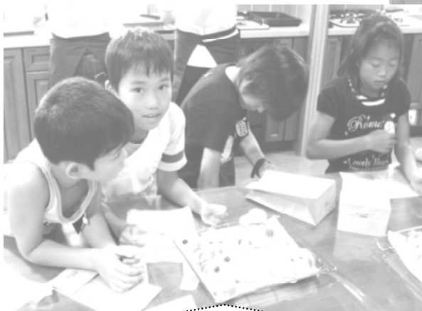
パンづくり楽しかったです